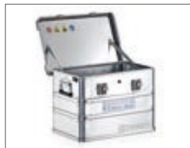
K 470, optional mit Schutzart IP 65

Gefahrgutverpackungen exakt wie Sie sie brauchen: Bei ZARGES können Sie aus einer breiten Auswahl von Größen und Bauweisen wählen.