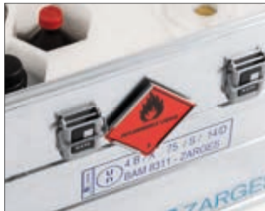
Gefahrgutklasse 3: Entzündbare flüssige Stoffe