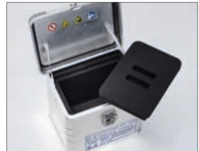
Isolierbehälter für temperaturgeführten Transport