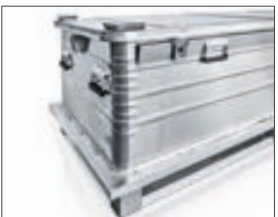
K 473 Schwerlastbehälter