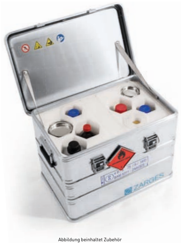
Abbildung beinhaltet Zubehör