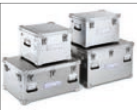
K 475 Transport- und Lagerbehälter