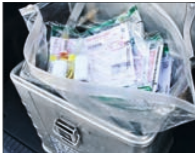
Gefahrgutklasse 6.2: Ansteckungsgefährliche Stoffe