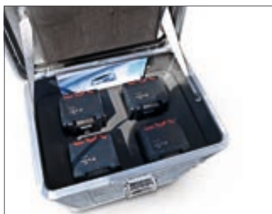
Gefahrgutklasse 9: Verschiedene gefährliche Stoffe und Gegenstände, z.B. Lithiumbatterien