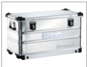
K 424 XC Mobil Box